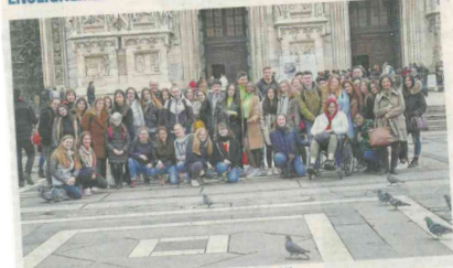
Tous les élèves, Français et Italiens, devant la cathédrale de Milan.