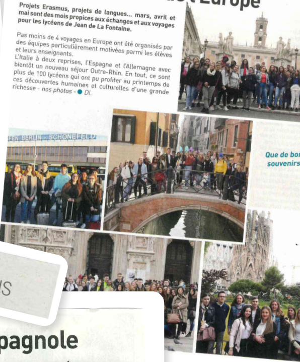
Que de bons souvenirs

Pas moins de 4 voyages en Europe ont été organisés par des équipes particulièrement motivées parmi les élèves et leurs enseignants. L'Italie à deux reprises, l'Espagne et l'Allemagne avec bientôt un nouveau séjour Outre-Rhin. En tout, ce sont plus de 100 lycéens qui ont pu profiter au printemps de ces découvertes humaines et culturelles d'une grande richesse